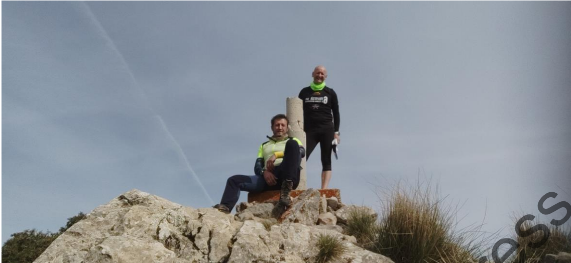
5 Vértice Geodésico Las Cabras

Desde el vértice geodésico debemos dirigirnos hacia los dos “dosmiles” que nos quedan: Cota 2018, y Cagasero, 2043. Aunque están visibles desde el vértice geodésico, en este tramo sí había que seguir algún track. Indicaciones sobre el terreno no llegamos a ver. Algún track nos llevaba prácticamente en línea recta hacia la cota 2018, casi pegados a una desvencijada valla que parece delimitar un coto privado de caza en el “Majal-Alonso”. Este track contenía una bajada por una zona con algo de exposición, lo cual rechazamos de inmediato, además de tener indicada otra “bajada técnica”. Por tal motivo, decidimos hacer un pequeño rodeo hasta llegar al nacimiento del Barranco Prado Guerrero y continuar por las Piedras de la Lobera hasta llegar a los pies de la cota 2018 para atacarla por el oeste.