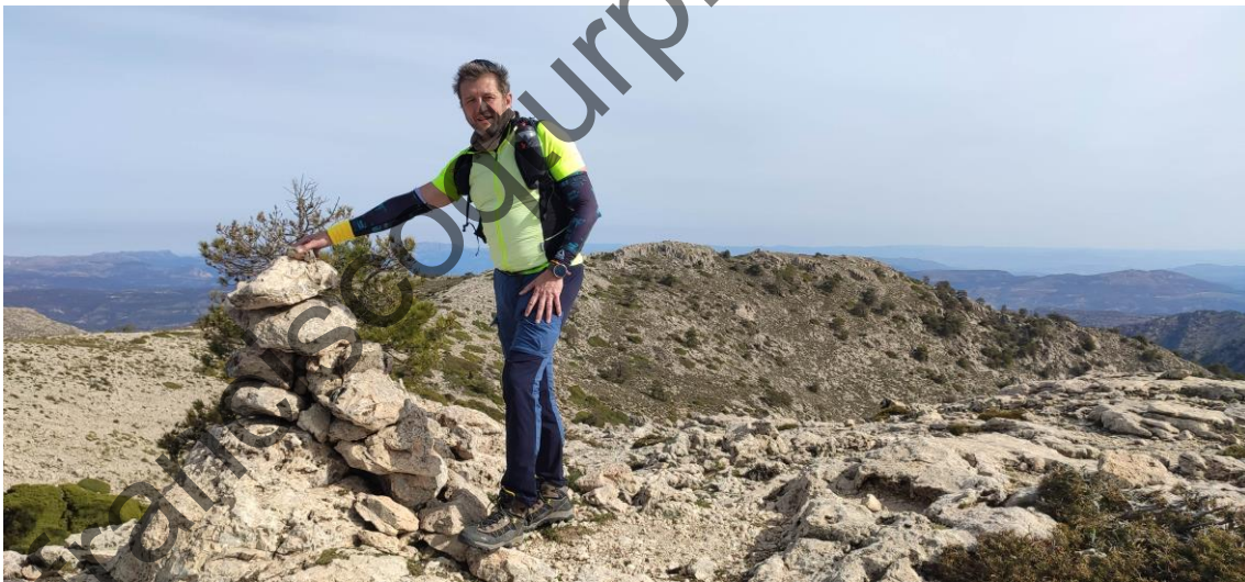
4 Cota La Atalaya, 2083 m, techo de la provincia de Albacete

Desde ella ya se divisa la especie de circo que forman los "dosmiles" de la sierra. Ya no es necesario track alguno, no mojones, puesto que la cota La Atalaya se divisa fácilmente, a unos 700 metros de distancia.