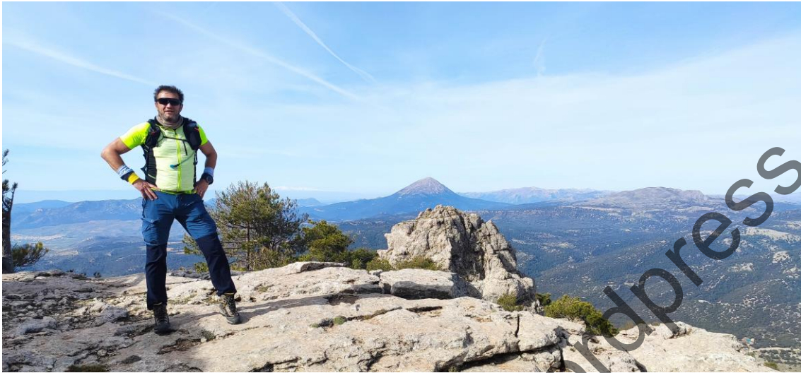
3 Cota "Calderón", 2071 m. La Sagra al fondo, junto a Sierra Nevada

La ascensión es exigente. No hay senda ni camino. Tenemos la referencia de los tracks y de los continuos mojones hábilmente colocados en varios tramos de la sierra. Tras tres kilómetros de ascensión, se corona la cota "Calderón" (2071m), primera de las cinco cotas superiores a los 2000 metros previstas para hoy.