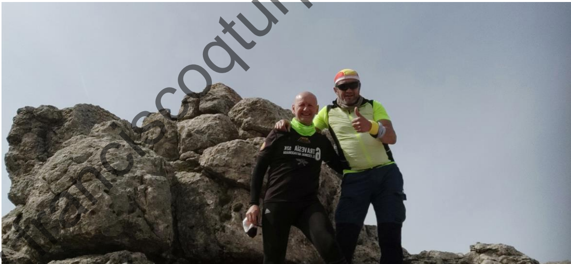
6 Cota 2018

Desde el vértice geodésico debemos dirigirnos hacia los dos “dosmiles” que nos quedan: Cota 2018, y Cagasero, 2043. Aunque están visibles desde el vértice geodésico, en este tramo sí había que seguir algún track. Indicaciones sobre el terreno no llegamos a ver. Algún track nos llevaba prácticamente en línea recta hacia la cota 2018, casi pegados a una desvencijada valla que parece delimitar un coto privado de caza en el “Majal-Alonso”. Este track contenía una bajada por una zona con algo de exposición, lo cual rechazamos de inmediato, además de tener indicada otra “bajada técnica”. Por tal motivo, decidimos hacer un pequeño rodeo hasta llegar al nacimiento del Barranco Prado Guerrero y continuar por las Piedras de la Lobera hasta llegar a los pies de la cota 2018 para atacarla por el oeste.