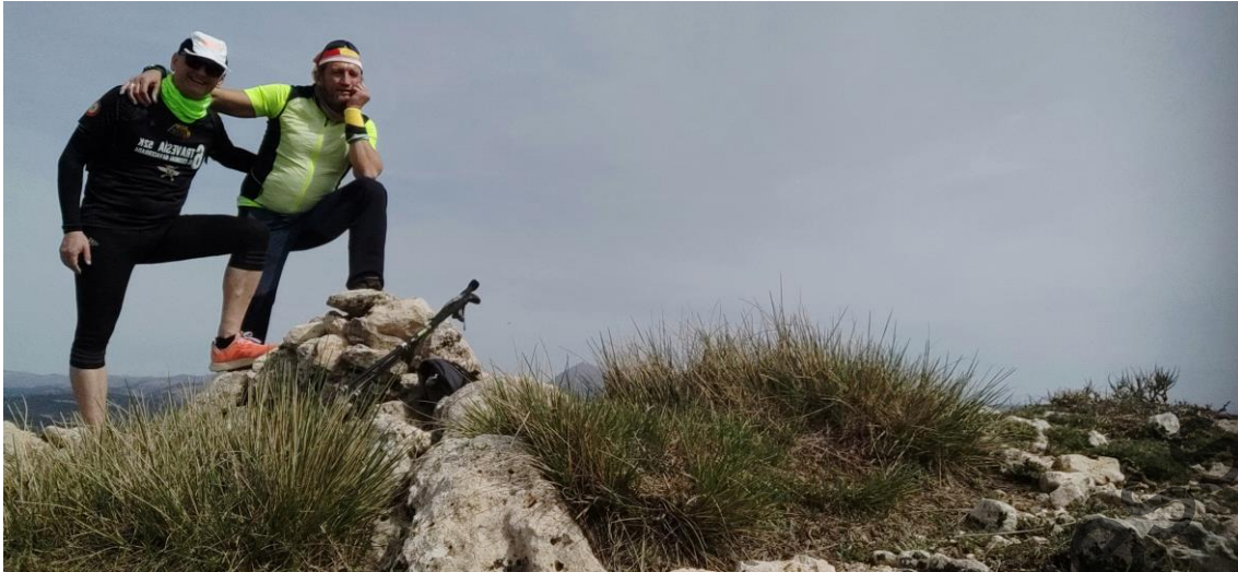
7 Cagaseo, 2043m

Desde el Cagaseo, se nos presentan varias opciones: una volver al Barranco Prado Guerrero y continuar su línea; otra intentar cresteo por el oeste, entre el Barranco Prado Guerrero y otro barranco sin nombre, que fue la elegida, y otra intentar el descenso por el Barranco de la Tejera.