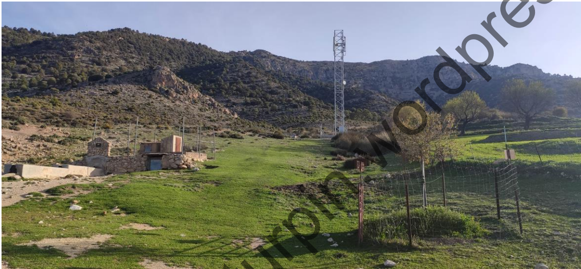
1 Inicio ruta Cortijo Fuente de la Carrasca

Volvemos, tras despuntar el alba, a Fuente de la Carrasca, en Nerpio, para intentar completar la ruta circular a la Sierra de las Cabras, donde encontraremos 5 cotas por encima de los 2000 metros de altura, entre las que se encuentra La Atalaya, que con sus 2083 metros, se convirtió (tras ajustar su medición) en el techo de la provincia de Albacete, al superar a su vecina Cabras (con su vértice geodésico situado a 2081 m). Llevábamos un par de tracks para la ocasión, entre ellos uno de ARÍSTIDES MÍNGUEZ ( https://es.wikiloc.com/rutas-senderismo/subida-a-la-sierra-de-las-cabras-atalaya-techo-de-albacete-85422512 ).