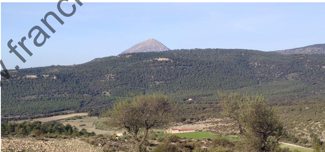
2 La Sagra, imponente

Conocíamos el punto de inicio y la subida a la cota Calderón de nuestro primer y frustrado intento (demasiado hielo, viento y frío). Intentamos repetir trazado. Pasamos junto al cortijo Fuente la Carrasca y comenzamos a subir por una rambla muy pedregosa, paralela a la rambla Majada Percha.